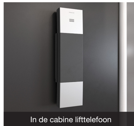
In de cabine lifttelefoon