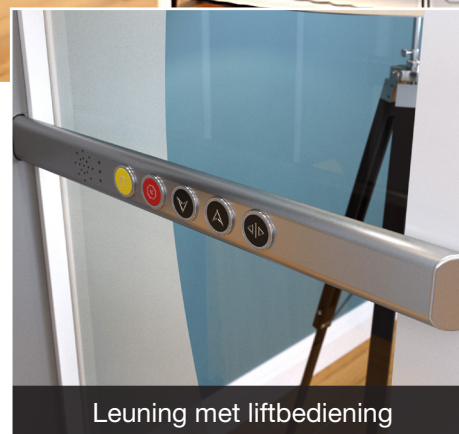
Leuning met liftbediening